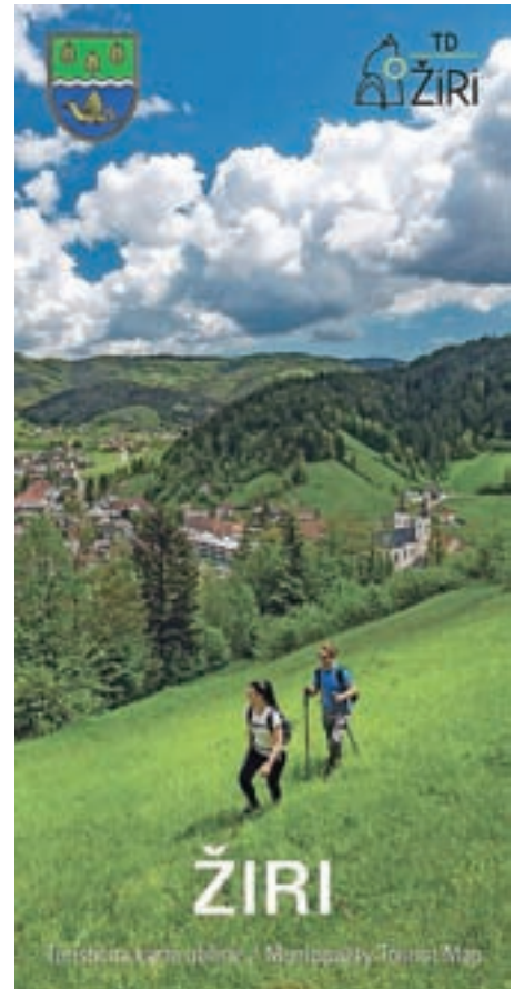
Naslovnica novega turističnega zemljevida Žirov

vzamemo zaslužene nagrade. Tako lahko katerokoli varianto Žirovskega kolesarskega kroga odpeljemo vsak dan v letu.