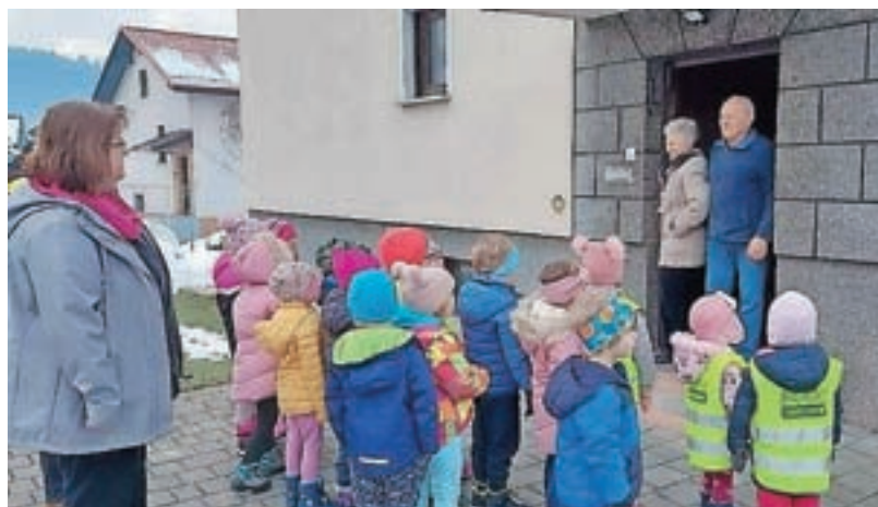
Letos so se prazničnemu obisku starostnikov pridružili tudi otroci iz Vrtca pri Sveti Ani v Žireh.

Januar, prvi povsem zimski mesec, je v vrtec prinesel nekaj športnega, olimpijskega duha! Zapadli sneg in zimske razmere so predšolski otroci z vzgojiteljicami izkoristili za izvedbo zimskega pohoda v okviru projekta Mali sonček. Oblečeni v bunde in kombinezone, s šali, rokavicami ter toplimi kapami