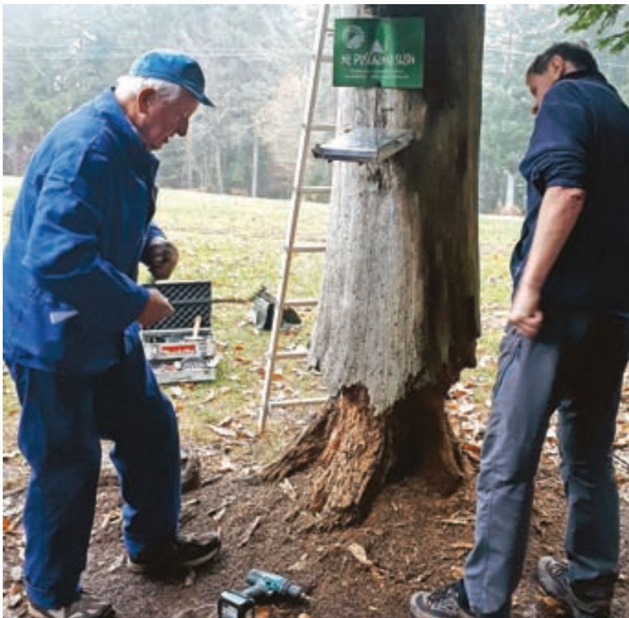
Trideset let je minilo, odkar so na eno od smrek na vrhu Javorča pritrtili skrinjico z zvezkom, v katerega naj bi se po zgledu nekaterih ostalih vrhov v Loškem pogorju vpisovali redni pohodniki na Javorč.

Danes vseh teh ceremonij okrog pohodov ni več, ampak je samo spisek pohodnikov in število pohodov, ki jih je posameznik opravil, nekaj časa po novem letu obešen zunaj pred kočjo.