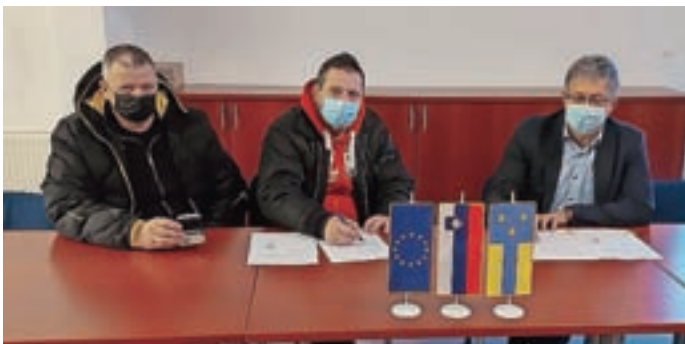
Podpis pogodbe z izbranim izvajalcem, podjetjem Hipnos iz Medvod

Izbrani izvajalec Hipnos bo pristojen za prvi prevoz pokojnika, umrlega na območju občine. "Ta zajema prevoz od kraja smrti do hladilnih prostorov oziroma do zdravstvene ustanove (zaradi izvedbe obdukcije, odvzema organov ali drugih postopkov) in uporabo hladilnih prostorov. Storitve bo zaračunana naročniku pogrebnih storitev po enotni ceni, ki jo bo določila občina," so pojasnili na občini in dodali, da vse druge storitve v zvezi s pogrebom ostajajo tržne, kar pomeni, da naročnik lahko izbere kateregakoli ponudnika pogrebnih storitev. To pomeni, so razložili, da bo v primeru, ko oseba umre na območju občine Žiri, treba poklicati izbranega koncesionarja, to je podjetje Hipnos, za prvi prevoz pokojnika do hladilnice. Kadar bo oseba umrla zunaj občine, bo prvi prevoz opravil izvajalec, ki je krajevno pristojen v kraju smrti. "Od tu naprej ni sprememb, svojci naročijo izvedbo pogreba tako, kot je veljalo do sedaj, pri izvajalcu pogrebnih storitev po lastni izbiri." Ni torej nujno, poudarjajo, da tudi pogreb opravi izvajalec prvega prevoza, svojci se lahko odločijo tudi drugače. Telefonska številka 24-urne dežurne službe: 051 620 699, elektronski naslov: hipnos@hipnos.si.