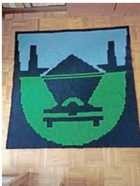
V sklopu projekta Slovenija kvačka je izdelala grb Občine Trbovlje.

bo zadoščalo za Guinnessov rekord, je pobudnica razširila projekt na 1001 kvačkan izdelek in nas povabila k nadaljnjemu kvačkanju." Ivica Novak se je lotila kvačkanja emotikonov oziroma smeškov.