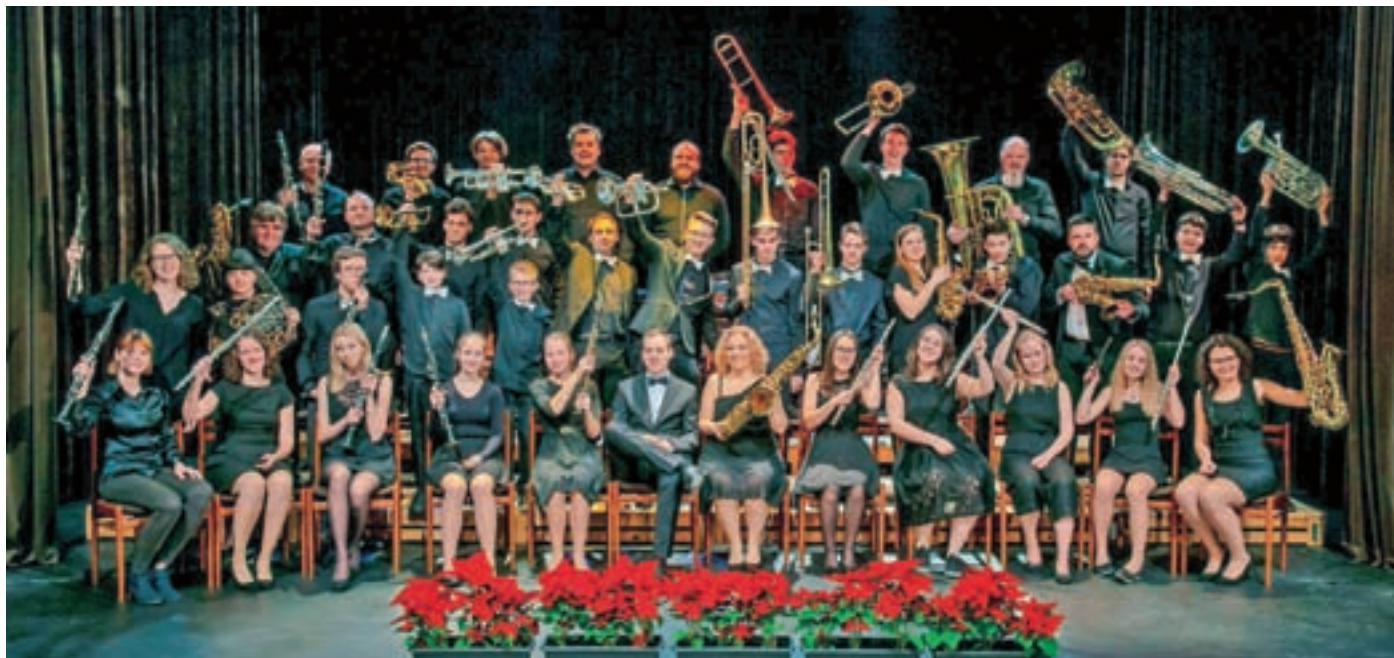
Pihalni orkester Alpina Žiri je po lanskoletnem prisilnem odmoru spet poskrbel za glasbeno obarvane božično-novoletne praznike.

Za zaključek pa napovedujemo, da letos ne bomo samo vadili, ampak bomo tudi več nastopali. Držimo pesti, da nam uspe že na pustni povorki, sicer pa smo optimistični, da nas boste spet slišali na budnici – v taki obliki, kot jo načrtujemo letos, je še niste doživeli. Namignemo vam lahko, da nas pričakujete tudi tisti, ki živite v okoliških krajih. Vneto že vadimo za letni koncert, ki ga bomo imeli v začetku junija, poleti pa si želimo uresničiti tudi idejo, da bi lahko zaigrali pohodnikom, ki obiskujete okoliške planinske kočice. Spremljajte našo Facebook stran, da nas kje ne zamudite!