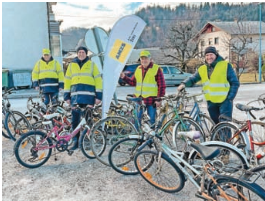
V AMD Žiri so minulo soboto izvedli akcijo Kolesa za vse!