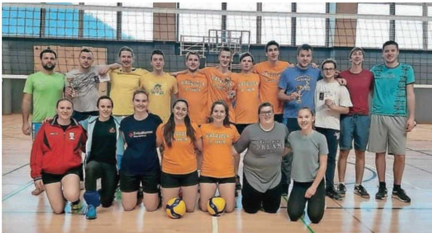
V dvorani v Žireh je sredi decembra potekal tradicionalni prednovoletni turnir v dvoranski odbojki.

sledila dva polfinalna obračuna s štirimi najbolje uvrščenimi ekipami rednega dela. Po veliko rešenih žogah, visokih blokih, neustavljivih udarcih in odličnih servisih smo dobili tri najboljše zasedbe. Na tretje mesto se je uvrstila domača ekipa Ambassade bistro. Zmagovalca je določil finale, v katerem sta se pomerili gostujoči ekipi Vornitzer in Karjola team – Blockhapp, od katerih je zadnja prikazala boljšo igro in osvojila turnir. Za nagrado so najboljše ekipe prejele pokale in nagrade, ki jih je prispeval TopCaffe.