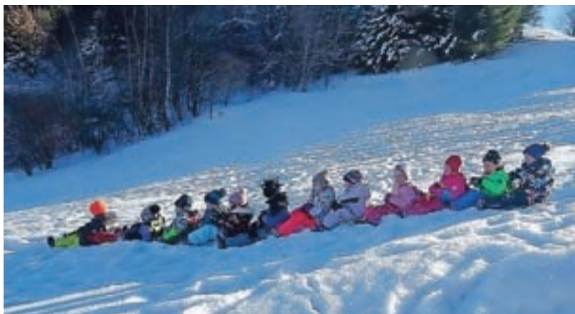
Otroško veselje na vrtčevski zimski olimpijadi

Po prazničnem začetku februarja, ko so se naučili zapeti tudi slovensko himno Zdravljico, pa so sredi meseca spoznali še Junake 3. nadstropja in njihove junaške zgodbe; 15. februarja, ob mednarodnem dnevu boja proti otroškemu raku, so namreč izdelali poseben plakat z zlato pentljico, simbolom moči, poguma in vztrajnosti, ter z njim poslali dobre želje vsem malim borcem na hemato-onkološkem oddelku UKC Ljubljana.