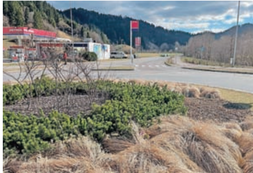
Gradnja obvoznice se bo nadaljevala od Petrola do mosta proti Logatcu.