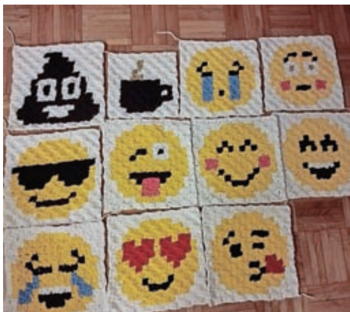
Za Guinnessov rekord je kvačkala tudi smeške.

Izkazalo se je, da izdelava hobotnic predstavlja tudi precejšen finančni zalogaj, zato se je znašla tako, da je na samostojni razstavi gobelinov, ki jo je pripravila v galeriji DPD Svoboda v Žireh, zbirala prostovoljne prispevke. "Nabralo se je dovolj, da sem imela za vse leto za material za hobotnice," je razložila. V Odeji Škofja Loka pa se je dogovorila, da so ji brezplačno zagotovili polnilo za hobotnice. "Napolnili so tako veliko vrečo, da sem jo komaj stlačila v prtljažnik avtomobila," se posmeje. Leta 2019 je tako nastalo 214 hobotnic, še bolj ambiciozen cilj