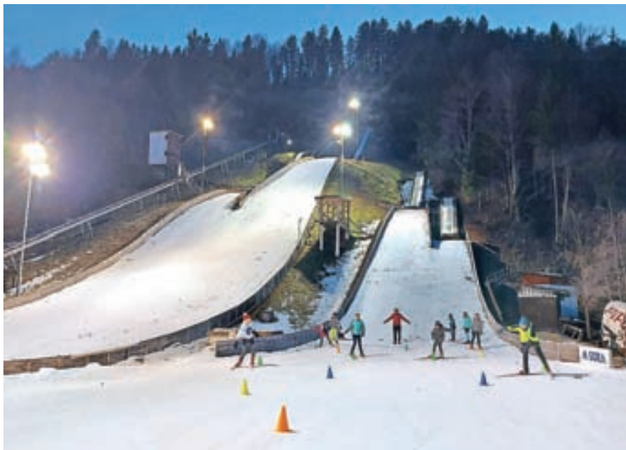
Smučarski skakalni klub Norica Žiri piše pravljico.

V klub vabimo še nove kandidate in kandidatke za žirovsko mlado letalno floto. Brez sramu nas obiščite v Nordijskem centru Poclain na Novovaški cesti ali pa nas kliknite na našem Facebook profilu SSK Norica Žiri. Vsem mladim skakalkam in skakalcem obljublamo dvakrat tedensko skakalno zabavo, ki bo otrokom preusmerila pozornost od telefonov in računalnikov.